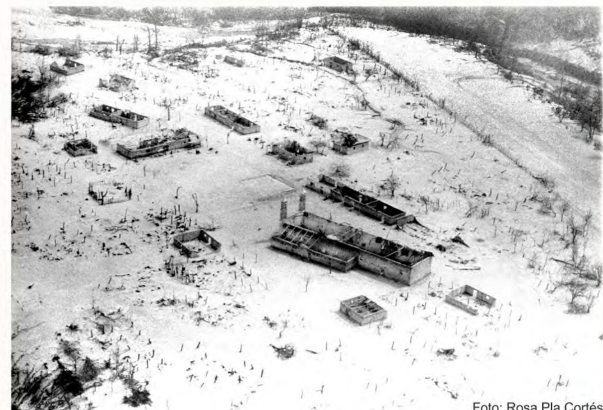
Poblado El Naranjo (al suroeste del Chichón): efectos por caída de cenizas en 1982.