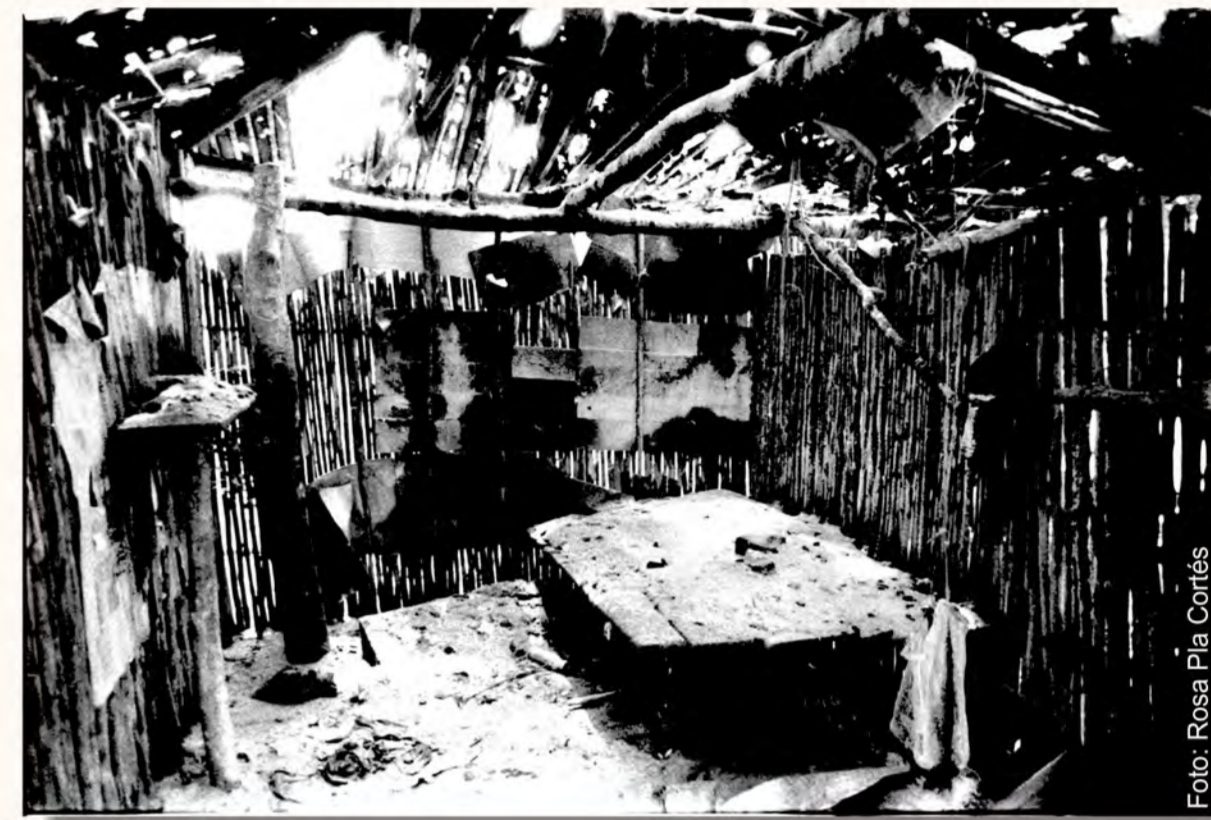
Detalle del interior de casa afectada por impacto de rocas y caída de cenizas en 1982.