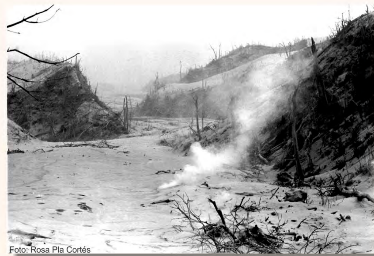
Daños causados por los flujos y las oleadas piroclásticas, en las cercanías del volcán, durante la erupción de 1982. Estos materiales, meses después de la erupción, mantenían temperaturas superiores a 400 °C.